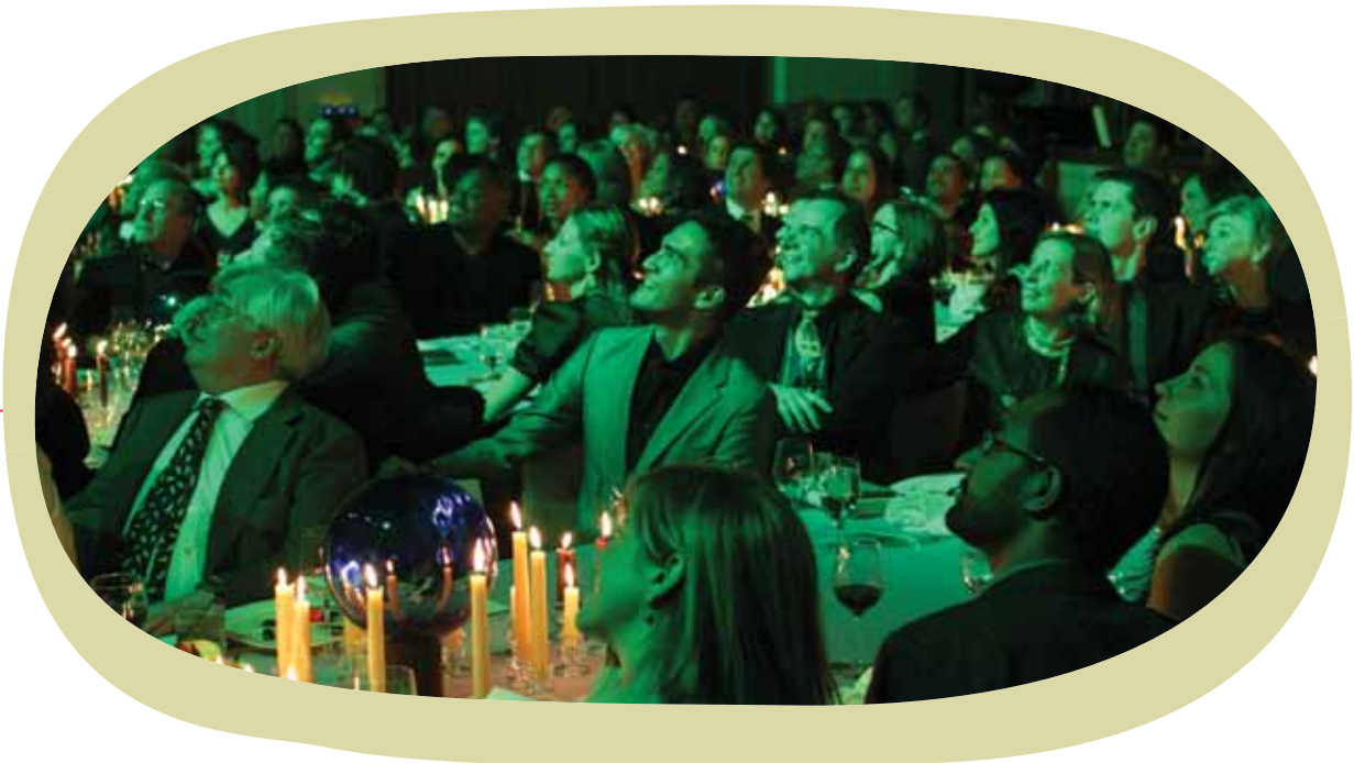
The Futurist Banquet As Seen During Milk Bathed In Green Light, An Appetizer: 2009

que as fronteiras do “estabelecido/comercial” e do “marginal” contam com uma história de sobreposições e margens difusas. O punk rock promovido pela indústria fonográfica no final dos anos 70 e a vida e a arte de Dash Snow nas páginas e capa da revista New York , em 2007, são apenas alguns exemplos recentes destas relações controversas.