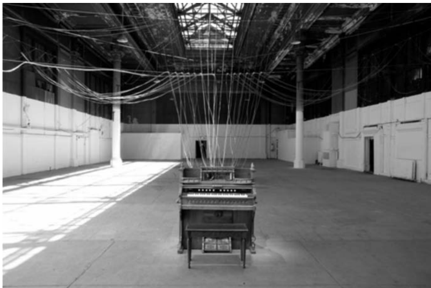
Figura 1 - Playing the Building : Instalação de David Byrne. Fotografia de Justin Ouellette, 2008. Cortesia Creative Time.

Neste texto, abordo algumas questões relacionadas à interatividade dos participantes em um trabalho de arte, tomando por objeto de estudo a instalação Playing the Building (Tocando o Edifício), concebida pelo músico e artista visual David Byrne. Por “interatividade” me refiro à possibilidade do participante – ao invés de espectador(a) – criar e/ou adicionar significado ao trabalho proposto por um(a) artista. Para este fim, sustentei minha pesquisa na Estética Relacional, termo cunhado