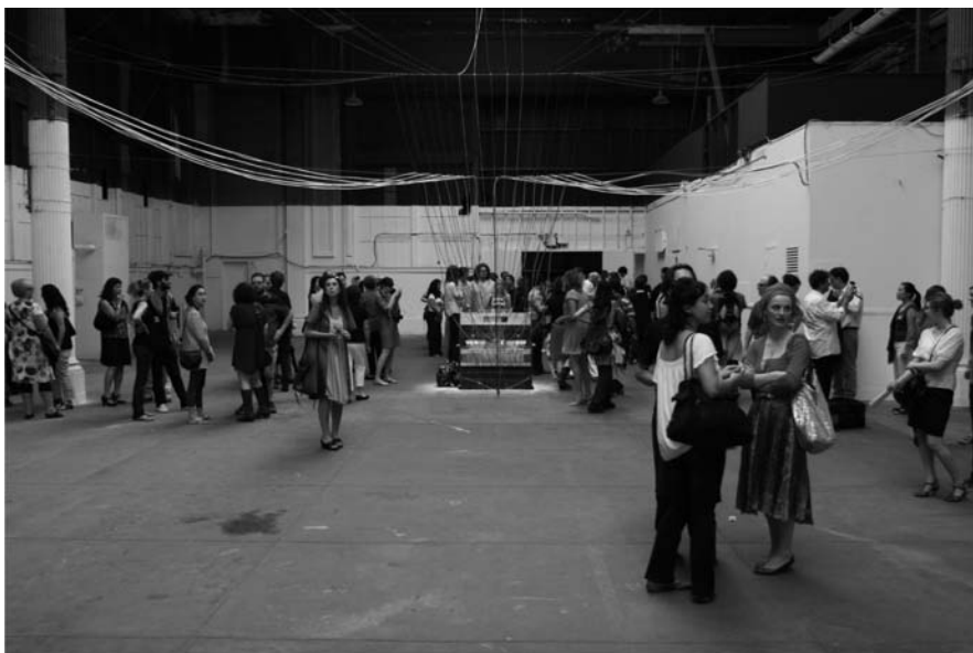
Figura 3 - Playing the Building: Instalação de David Byrne. Fotografia de Sam Horine, 2008. Cortesia Creative Time.